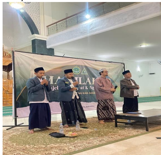
Gambar 1. Pembacaan Maulid MASLAHAT

prestise tersendiri di kalangan pelajar se-Kabupaten Madiun.